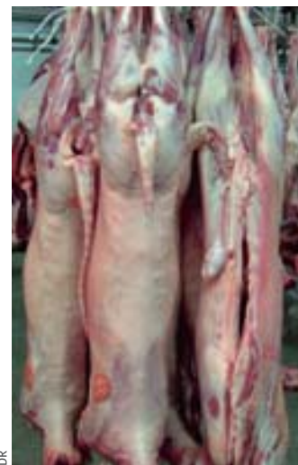
Le travail réalisé avec l'université de Saragosse a amélioré la santé et la croissance des agneaux.

ainsi les élevages à problèmes et de traiter ces pathologies peu visibles mais qui influent sur la croissance des agneaux, sur leur vitalité et qui favorisent l'apparition d'autres pathologies moins silencieuses.